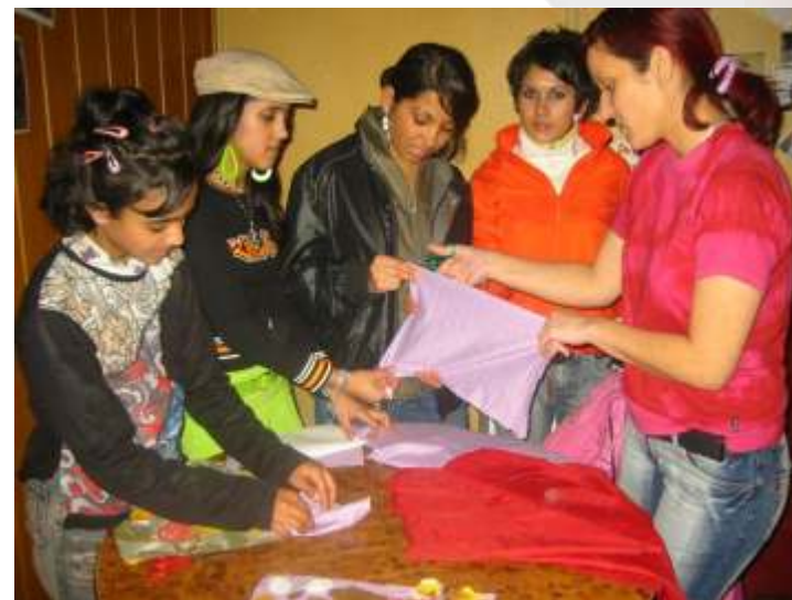
V nízkoprahovom klube „3Pé“ v Luenci ako aj v klube v Cinobani, ktoré zriadila organizácia IN Network sú tvorivé dielne jednou z mnohých aktivít, ktoré ponúkajú mladým ľuďom.

Okrem priamej finančnej podpory sme hľadali aj ďalšie spôsoby podpory inštitucionálneho rozvoja a stabilizácie nízkoprahových zariadení na Slovensku. V období od decembra 2005 do mája 2006 zrealizovali z vlastných prostriedkov druhý ročník Dlhodobého vzdelávacieho programu pre pracovníkov nízkoprahových zariadení . Vzdelávanie pre 20 účastníkov prebiehalo v piatich viacdňových tréningových blokoch zameraných na špecifickú problematiku nízkoprahových zariadení (priama práca s klientom, streetwork, princípy nízkoprahovosti, metodika práce, ochrana práv detí a mládeže, získavanie zdrojov,